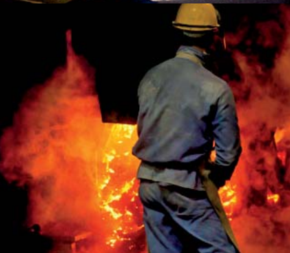
Fusion (Fonderie la Persévérance) © ACAPPI