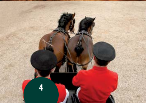
Haras de Montieren-Der