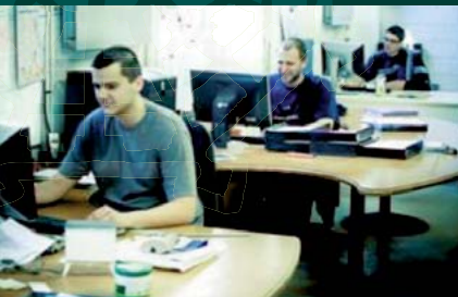
Bureau d'Etudes (Fonderie D2)