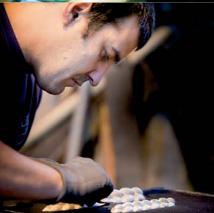
Moulage (Fonderie Rocroyenne d'Aluminium)