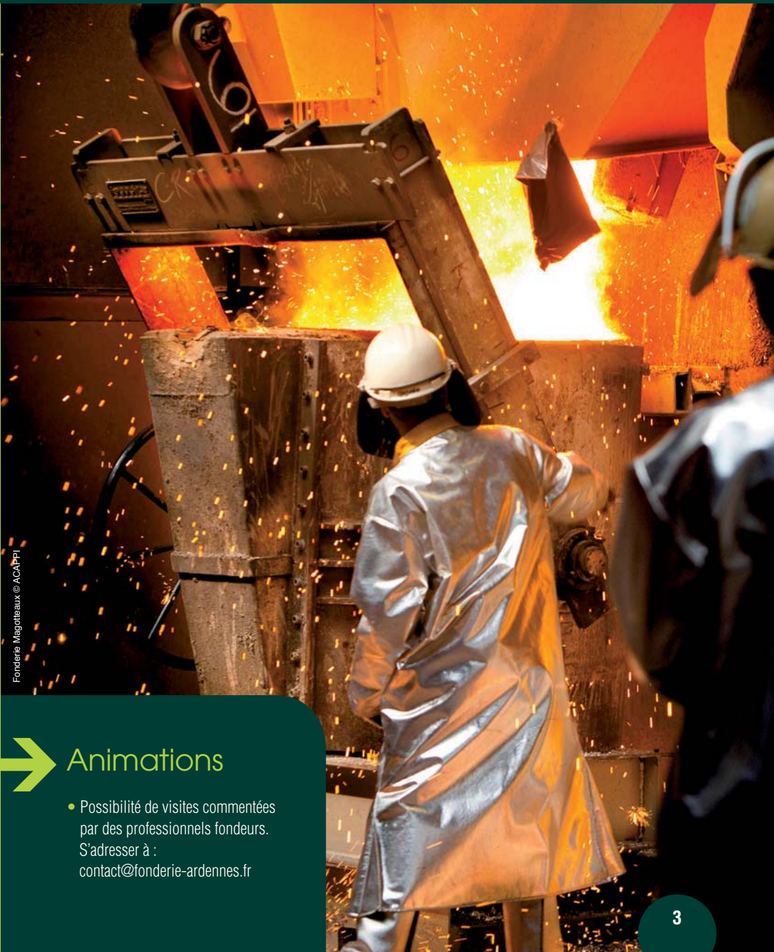
Fonderie Magatteaux