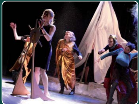
Festival Jeune Comédie © Simon GENIN