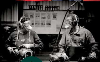
Ebarbage (La Fonte Ardennaise)