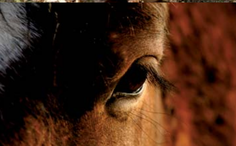
Euilly-Lombut © Céline LECOMTE