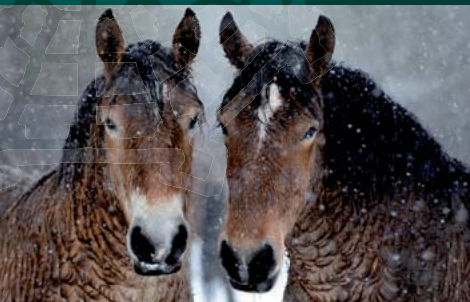
Bestel Malmaison