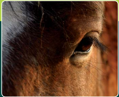
Cheval ardennais